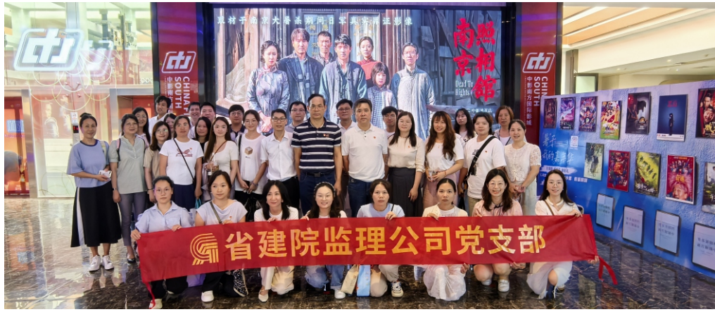
广东建设工程监理有限公司

部电影，更是一部生动的历史教材。它时刻提醒着我们要铭记历史，勿忘国耻。在新时代，我们更应从这段历史中汲取奋进的力量，立足本职岗位，努力拼搏，为实现中华民族伟大复兴的中国梦贡献自己的力量。