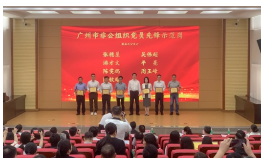
广州市市政工程监理有限公司