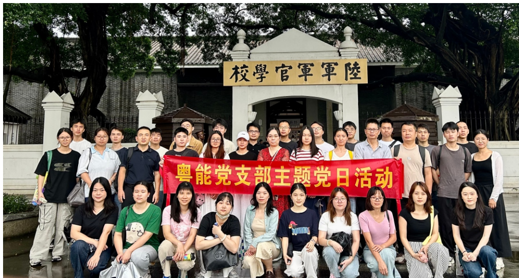
广东粤能工程管理有限公司

此次活动不仅是一次红色教育，更是一次廉政警示。大家纷纷表示，要在工作恪守廉洁底线，共同营造风清气正的企业环境，以专业规范的服务推动公司高质量发展。