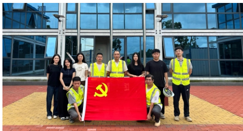
广东粤能工程管理有限公司