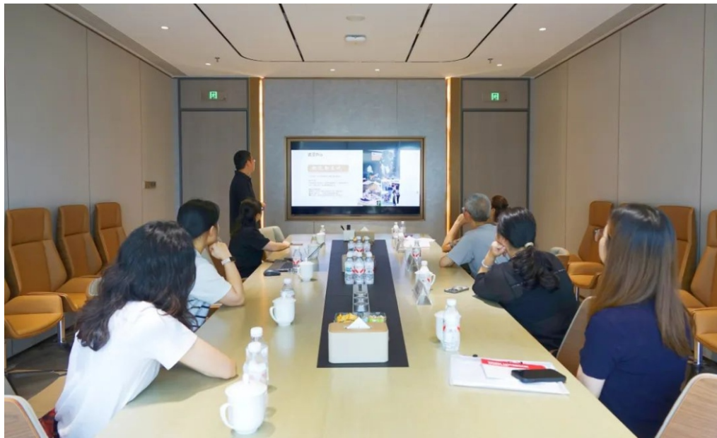
广州市建设监理行业协会

通过此次深入探讨，全体党员深刻领悟到科技创新在驱动产业升级、铸就高品质生活方面的关键价值。协会将以党建引领为核心，积极推动技术融合、前沿创新以及强化产业协同发展，为行业高质量发展贡献专业力量。