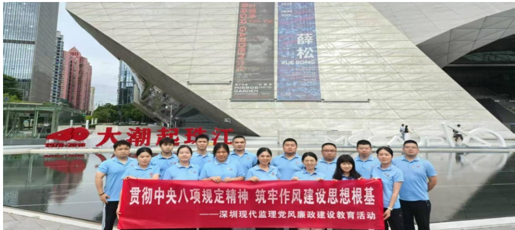
深圳现代建设监理有限公司

此次主题党日活动，围绕广东改革开放40年的辉煌历程，通过直观生动的展览形式，学习改革开放伟大历程，党员们在活动中触摸革命历史的滚烫印记，更深刻领悟到肩负的历史使命与时代担当。展望未来，公司将以此次活动为契机，传承革命精神，深化党建引领，持续引导广大党员以更加饱满的热情、更加昂扬的斗志、更加务实的作风，投身到公司高质量发展各项工作中！