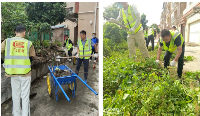
广东工程建设监理有限公司